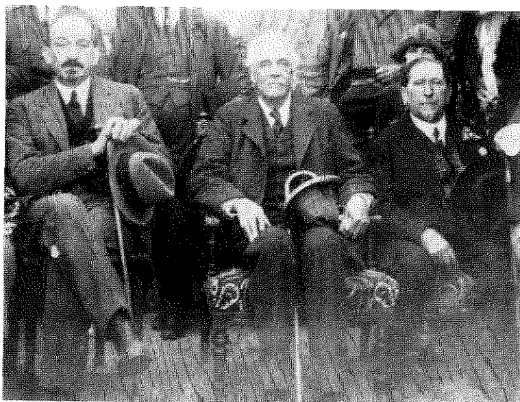
שלושה מחתני השמחה – הלורד ארתור בלפור, אבי ההצהרה הנודעת הנושאת את שמו, ד"ר חיים וייצמן (משמאל) ונחום סוקולוב. חגיגות פתיחת האוניברסיטה העברית נמשכו כשבוע ימים וארץ ישראל היהודית היתה נתונה באופוריה